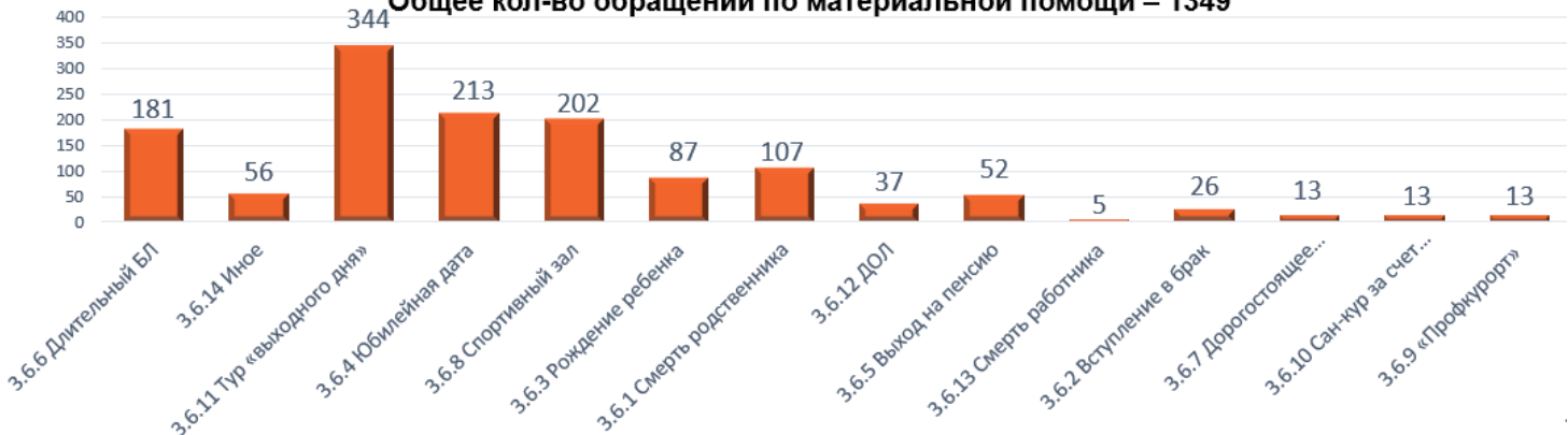
Рисунок 1 - Сведения о расходах на материальную помощь за 2023 г.

Общее кол-во обращений по материальной помощи – 1349